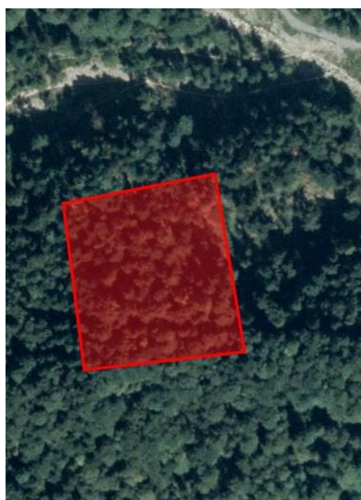
Luftbild 2004