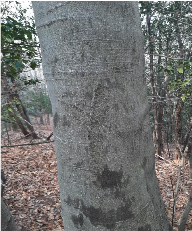
Figura 8: Segni di una vecchia martellata, probabilmente risalente agli anni '60.