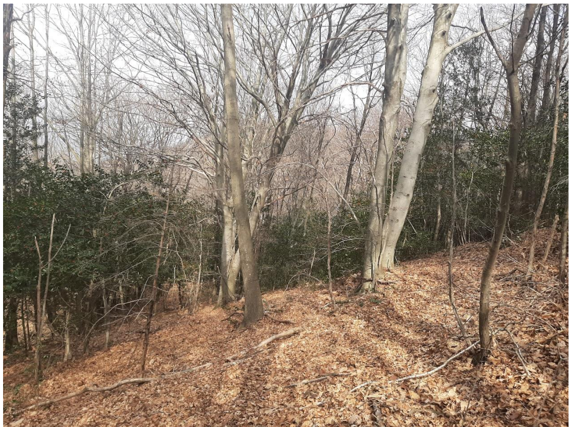
Figura 5: Scatto sul punto 5 centrale (vedi formulario NaiS 1)