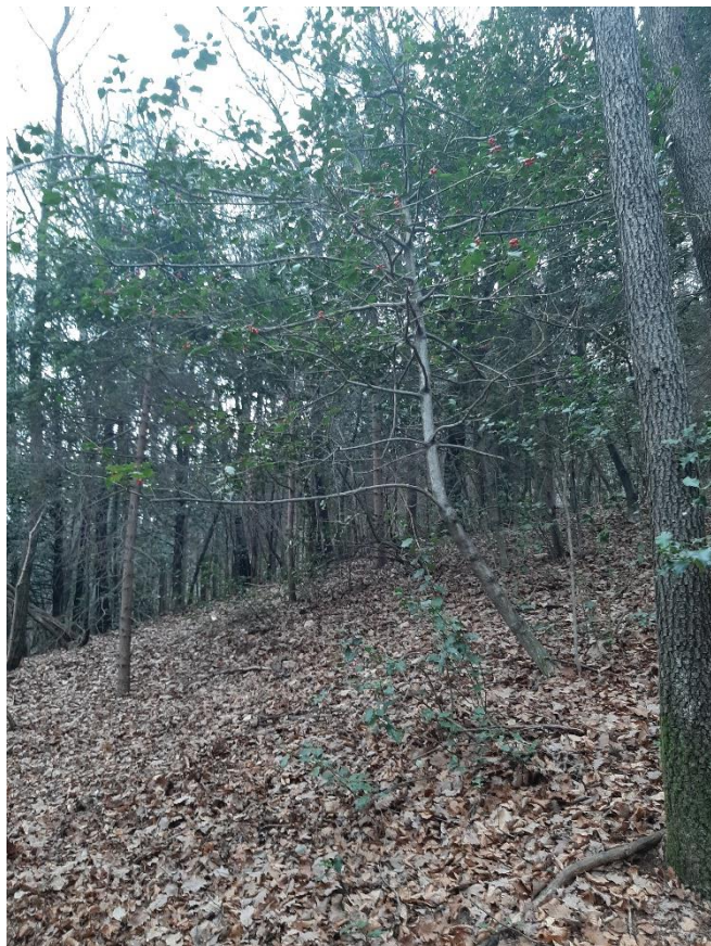
Figura 1: scatto dal punto 1 (vedi formulario NaiS 1)

Foto dagli angoli in direzione diagonale all'altro capo della parcella e centro