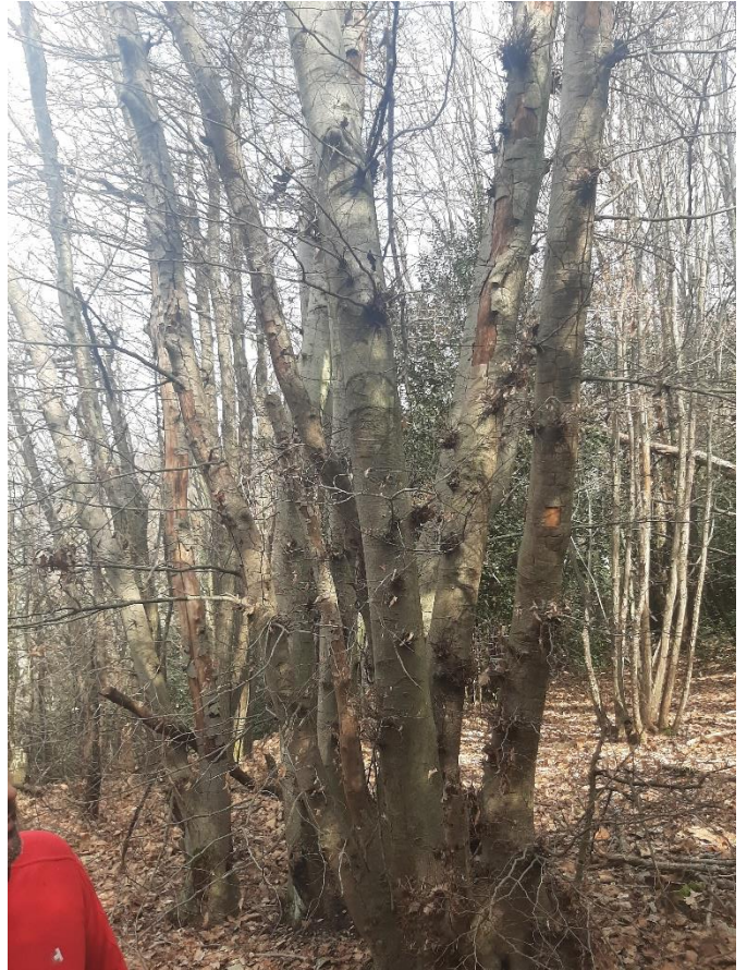
Figura 11: Ceduo invecchiato e morente di faggio