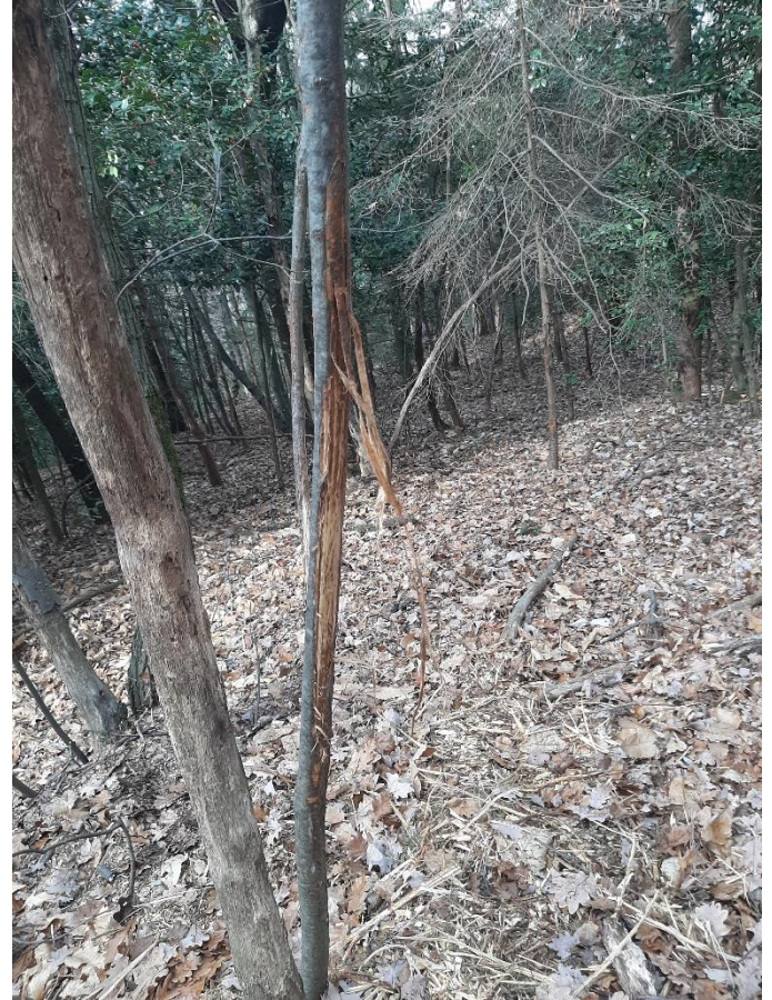
Figura 6 e 7: Danni da sfregamento da selvaggina sulle giovani piante