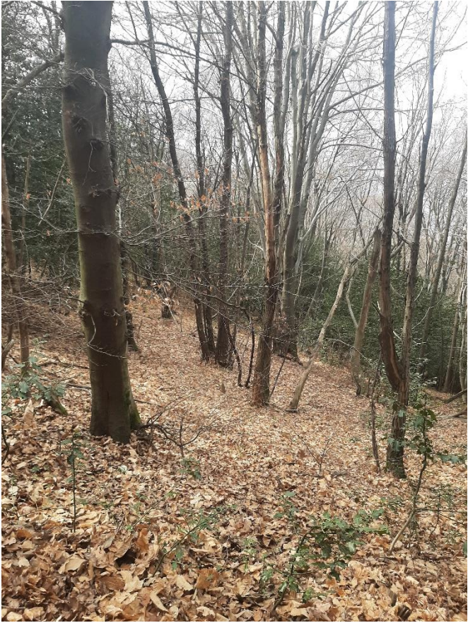
Figura 3: scatto dal punto 3 (vedi formulario NaiS 1)