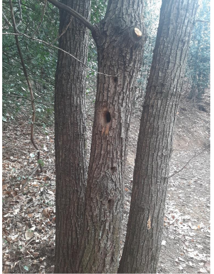
Figura 13: Fusto con buco del picchio sul tornante della strada forestale