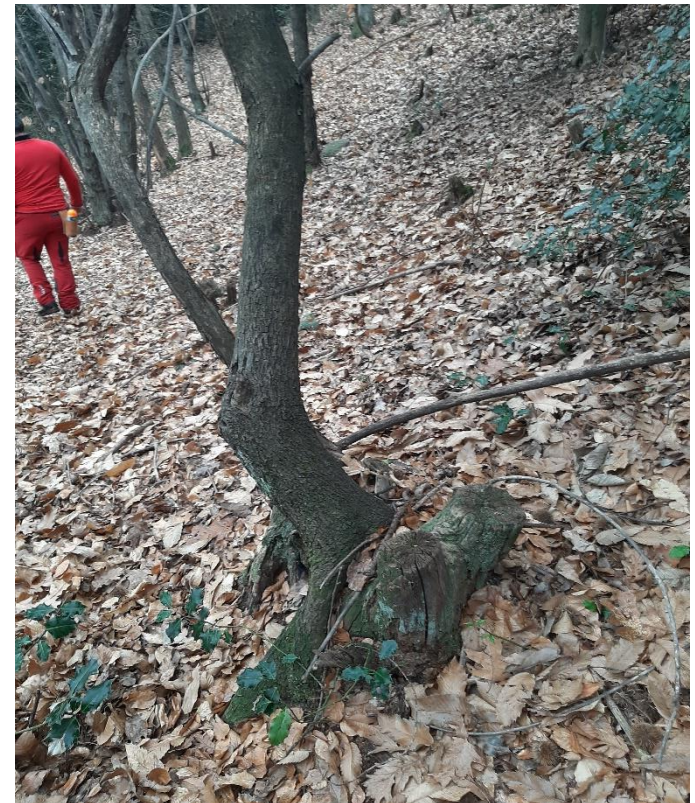
Figura 9: Residui del vecchio intervento