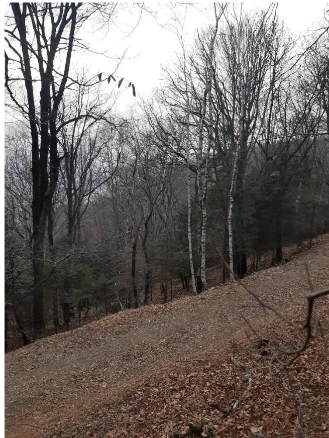
Figura 2: scatto dal punto 2 (vedi formulario NaiS 1)