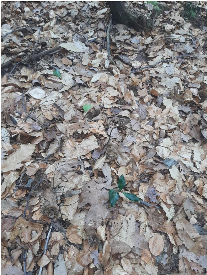
Figura 12: Giovani piantina di faggio (poco visibile) e plantula d'agrifoglio