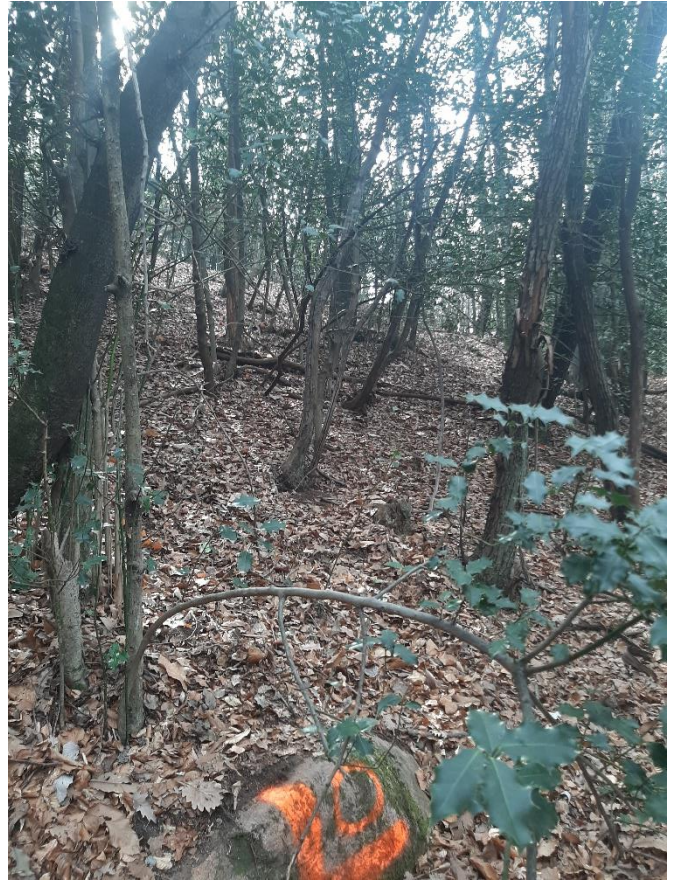
Figura 4: Scatto dal punto 4 (vedi formulario NaiS 1)