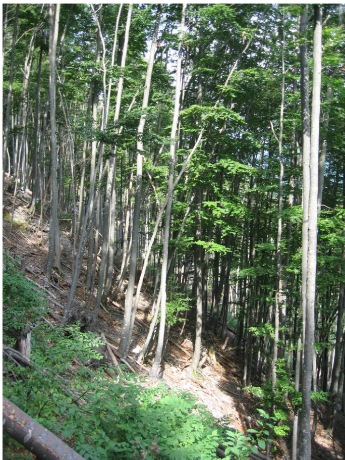
Fotostandort 7 = 11 m von der N-Ecke neben dem anstehenden Fels. Blick Richtung NO.