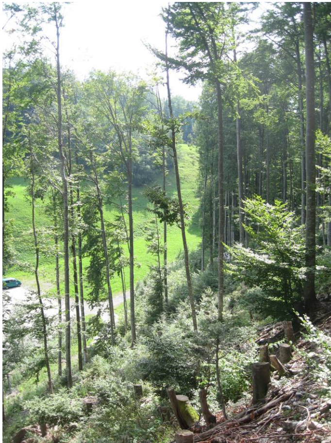
Fotostandort 4 = auf dem Block 16 m hangaufwärts vom Grossblock. Blick Richtung S.

Entwicklung des verbleibenden Bestands, speziell der Kronen?