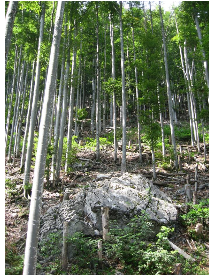
Fotostandort 2 = gleicher Standort wie 1. Blick Richtung NW.