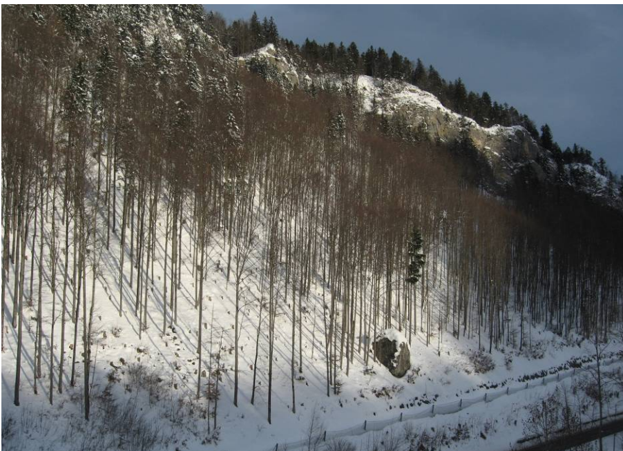
Gegenhangfoto 2, Fotostandort Weide über dem Schwingplatzcher