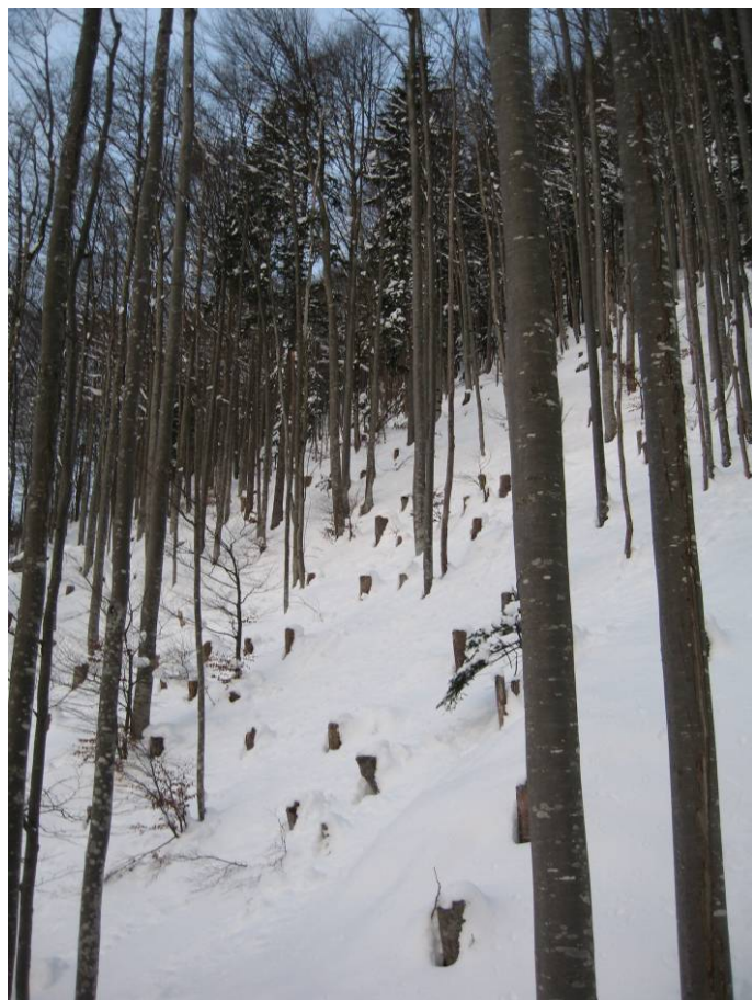
Fotostandort 1 = auf dem Grossblock (21 m von der S-Ecke). Blick Richtung W.