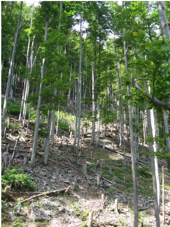
Fotostandort 3 = gleicher Standort wie 1. Blick Richtung N.