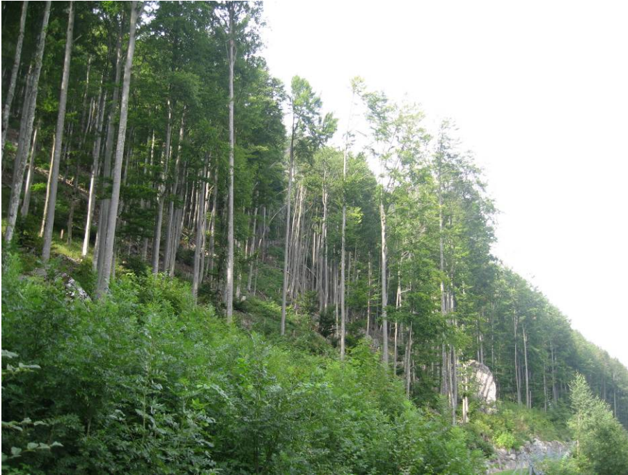
Fotostandort 9 = Wiese hinter dem Schwingplatzcher Blick Richtung N.