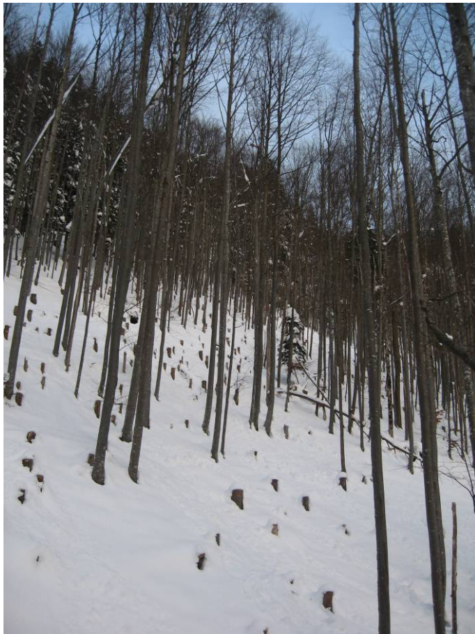
Fotostandort 3 = gleicher Standort wie 1. Blick Richtung N.