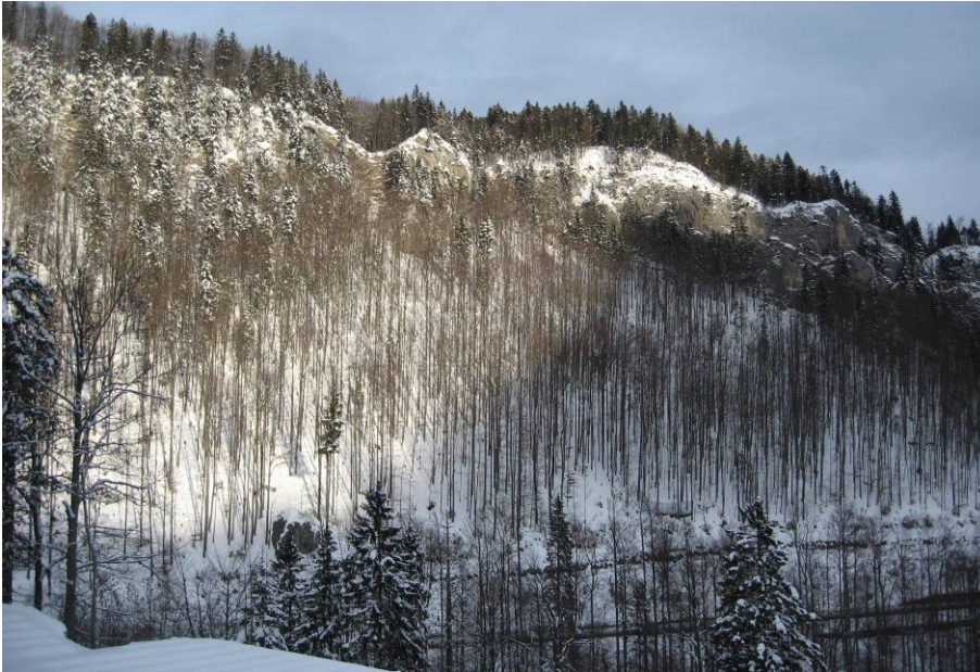
Gegenhangfoto 1, Fotostandort Schwingplatz