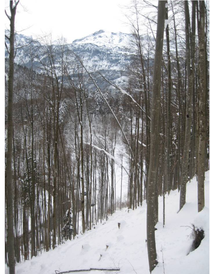
Fotostandort 8 = gleicher Standort wie 7. Blick Richtung S.

Stabilität des Bestandesrand? Entwicklung der Kronen?