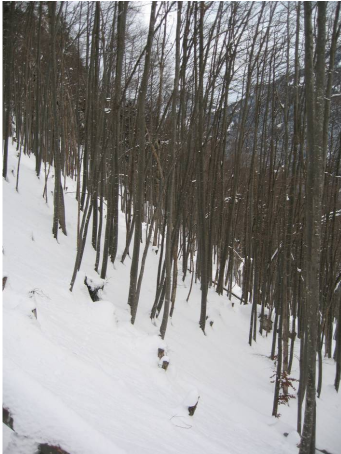
Fotostandort 7 = 11 m von der N-Ecke neben dem anstehenden Fels. Blick Richtung NO.