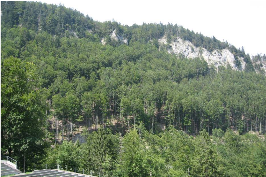
Gegenhangfoto 1, Fotostandort Schwingplatz