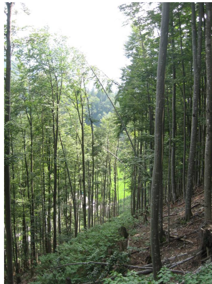
Fotostandort 8 = gleicher Standort wie 7. Blick Richtung S.

Stabilität des Bestandesrand? Entwicklung der Kronen?