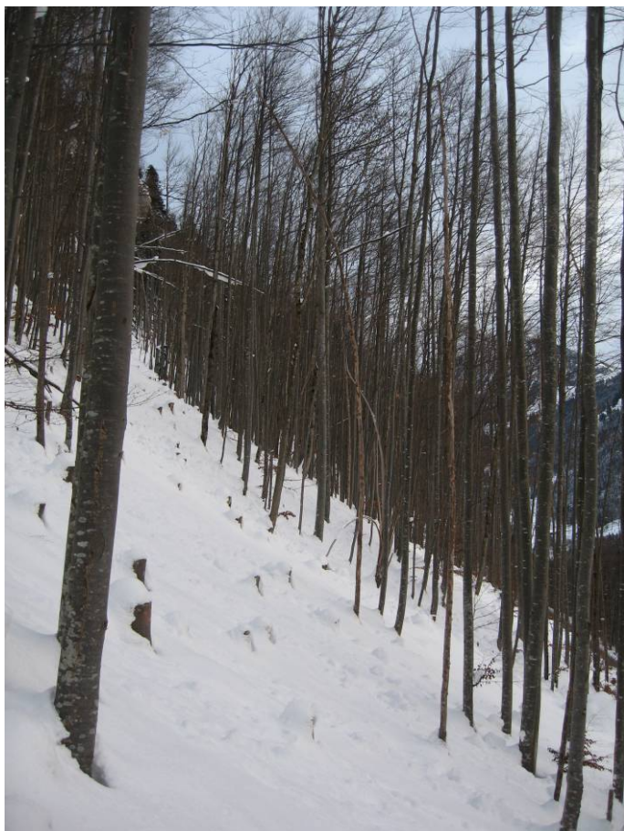
Fotostandort 5 = gleicher Standort wie 4. Blick Richtung NO.