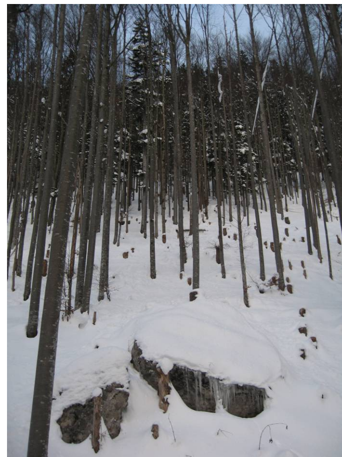
Fotostandort 2 = gleicher Standort wie 1. Blick Richtung NW.