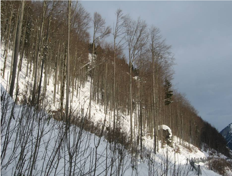
Fotostandort 9 = Wiese hinter dem Schwingplatzcher Blick Richtung N.