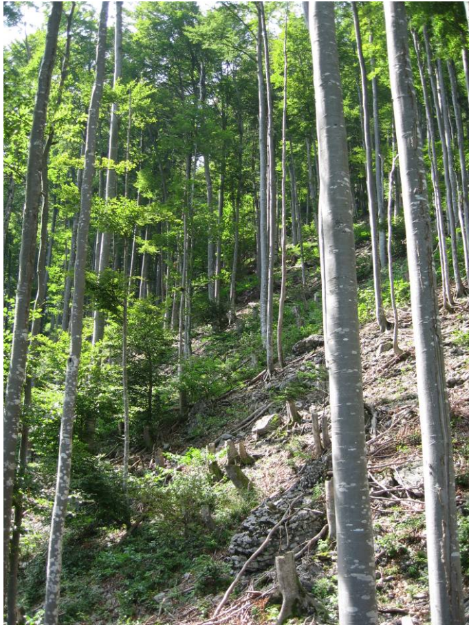
Fotostandort 1 = auf dem Grossblock (21 m von der S-Ecke). Blick Richtung W.