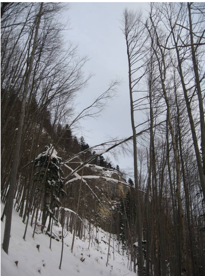
Fotostandort 10 = gleicher Standort wie 6 auf der Grenze der Weiserfläche Blick Richtung N ausserhalb der Weiserfläche.