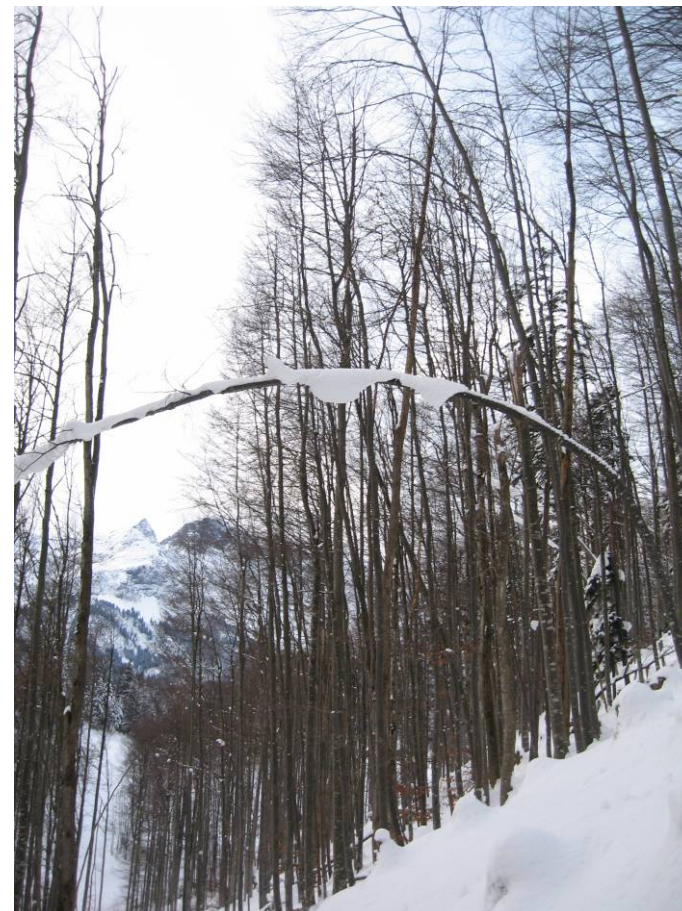
Fotostandort 6 = auf der Grenze der Weiserfläche. Blick Richtung S.

Stabilität des verbleibenden Bestands entlang der Seillinie? Entwicklung der Kronen und der Verjüngung?