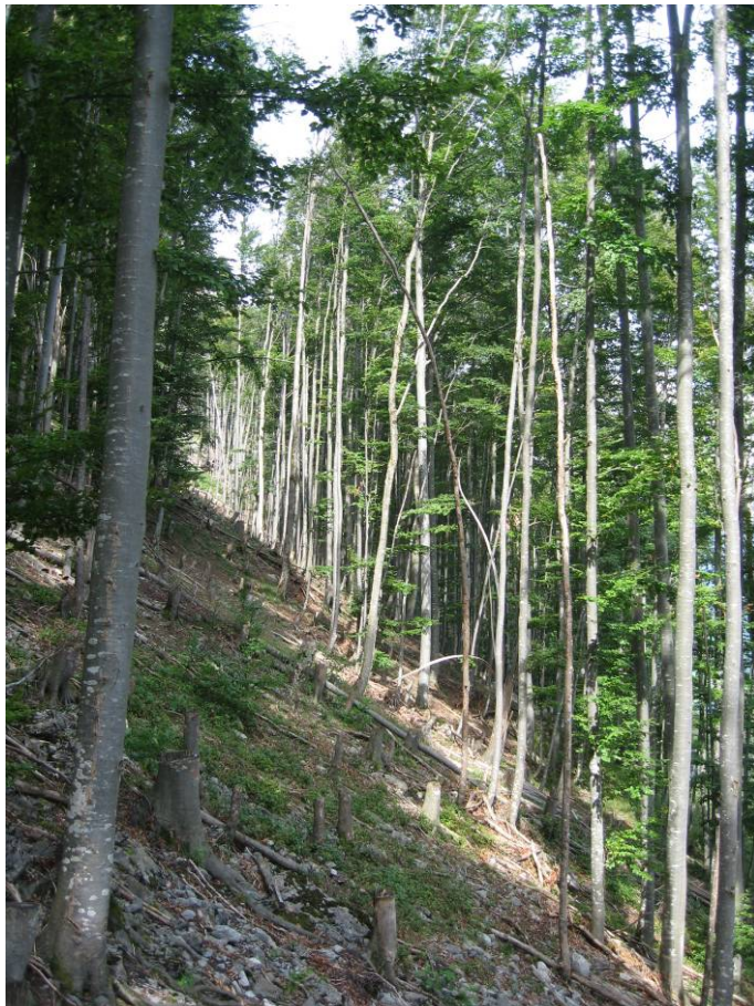
Fotostandort 5 = gleicher Standort wie 4. Blick Richtung NO.