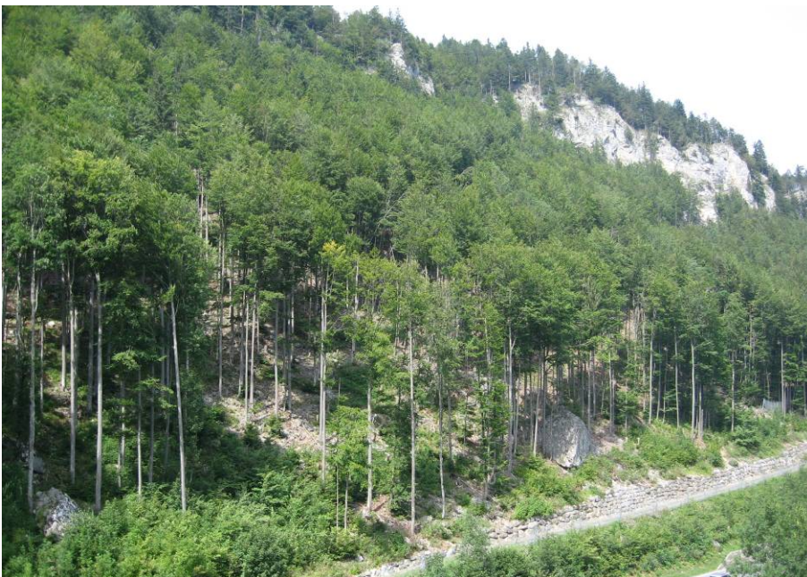
Gegenhangfoto 2, Fotostandort Weide über dem Schwingplatzcher