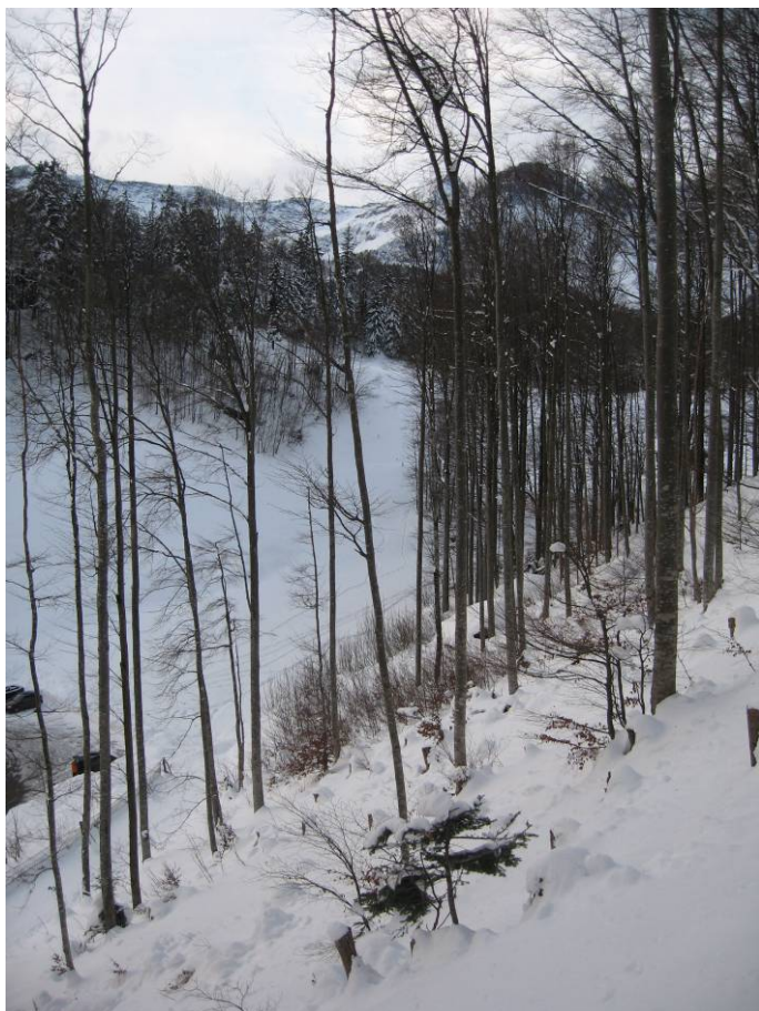
Fotostandort 4 = auf dem Block 16 m hangaufwärts vom Grossblock. Blick Richtung S.

Entwicklung des verbleibenden Bestands, speziell der Kronen?