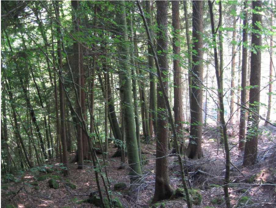
Fotostandort 3 (Beschreibung siehe oben). Blick Richtung SW.