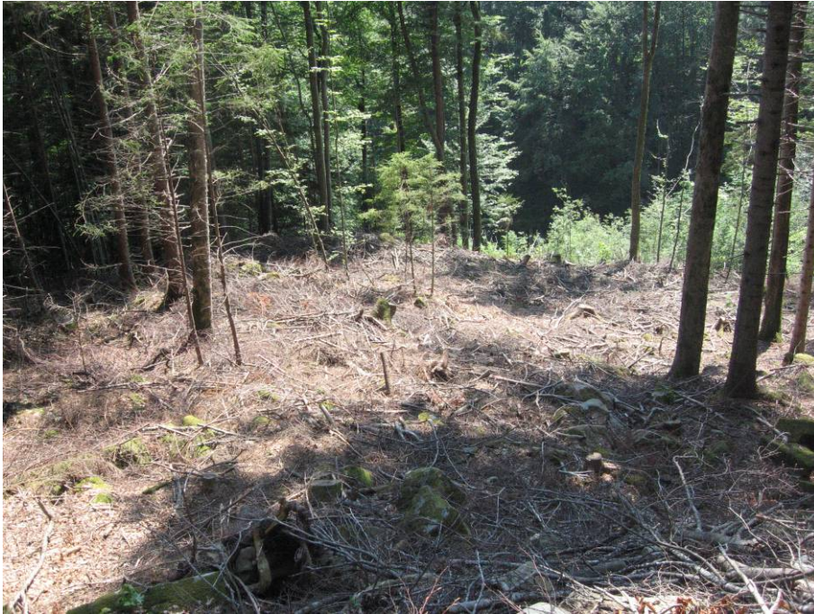
Fotostandort 5 (Beschreibung siehe unten). Blick in der neuen Schlagfläche vom Dezember 2007 nach unten = nach Süden.