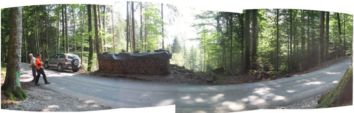
Fotostandort 4 = 4 m oberhalb der Strasse, 41 m von der NO-Ecke. Blick über die Strasse in die Weiserfläche Richtung Süden.