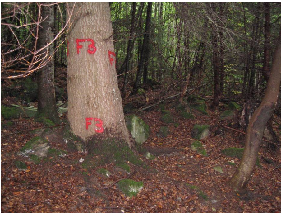
Standort Foto 3 = am Ostrand der Weiserfläche, an einer Weisstanne.