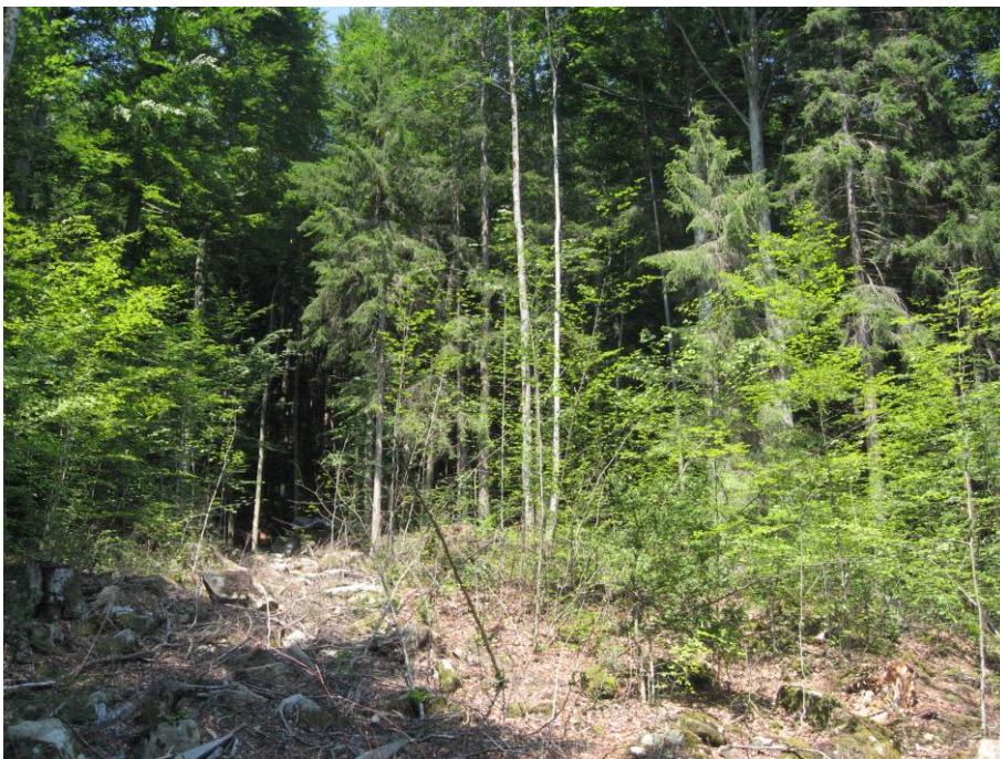
Fotostandort 5 (Beschreibung siehe unten). Blick in der Schlagfläche vom Dezember 2007 nach oben = nach Norden.