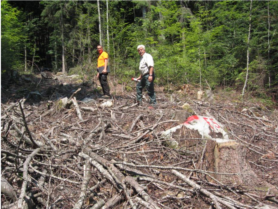
Standort Foto 5 = in der Schlagfläche vom Dezember 2007, markiert auf einem Block.