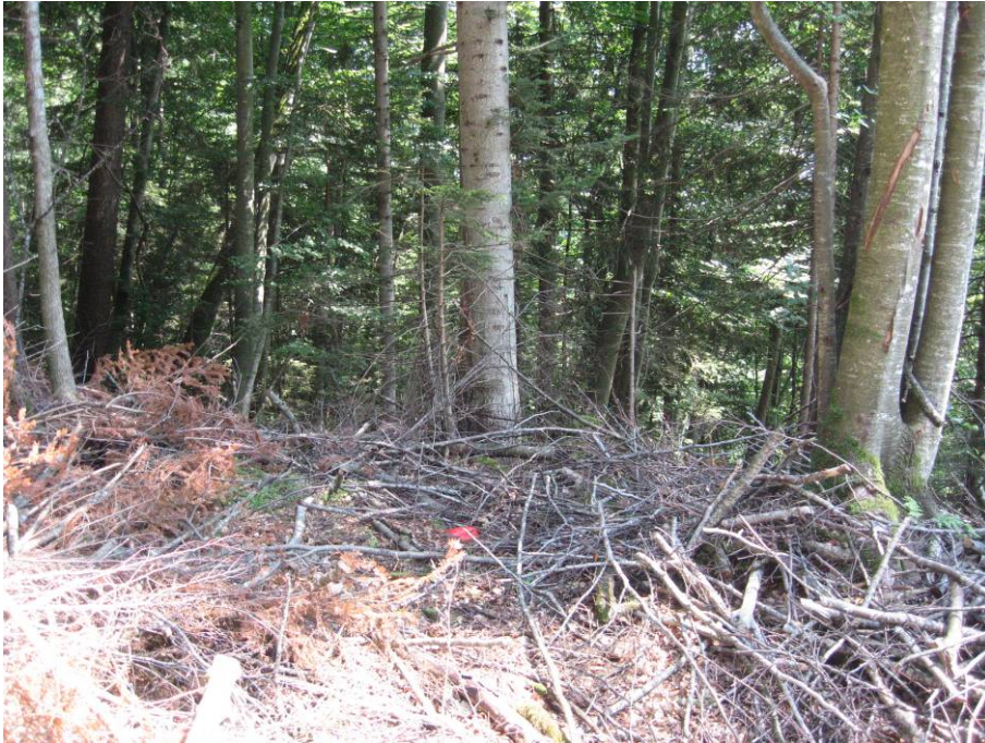
Standort Foto 2 = Rand der alten Glaubenbergstrasse, 15 m von der N-Grenze, markiert mit roter Farbe auf einem Stein.