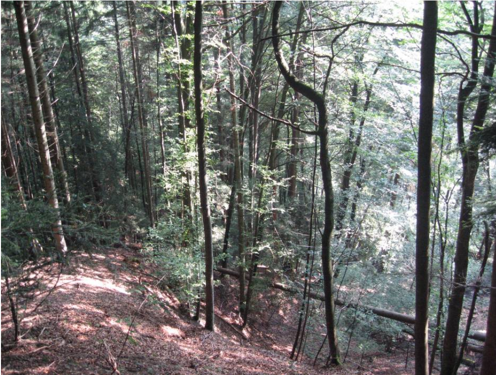
Fotostandort 7 etwas östliche der SW-Ecke; Blick Richtung NNO 27.08.2007