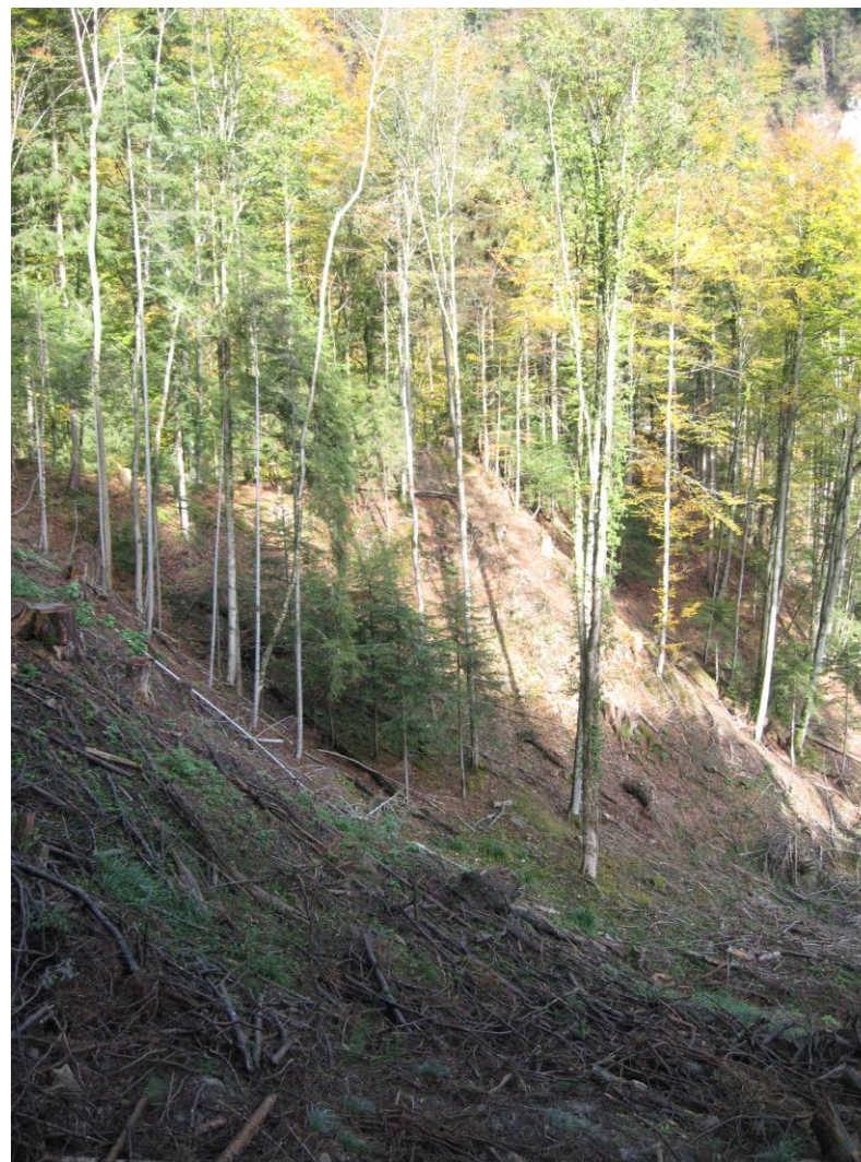
F02 nach Holzschlag 24.10.2009