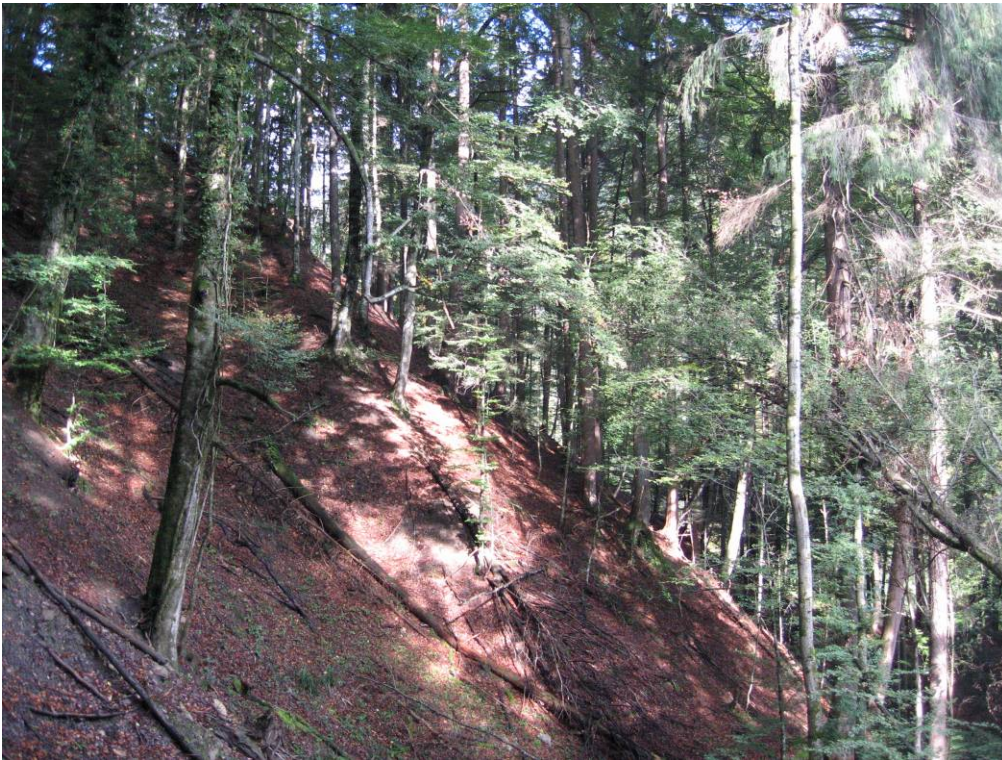
Fotostandort 2 Blick Richtung WNW 19.09.2007