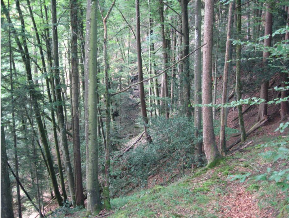
Fotostandort 4 vier Meter südlich der NW-Ecke der Weiserfläche; Blick Richtung SSO 27.08.2007