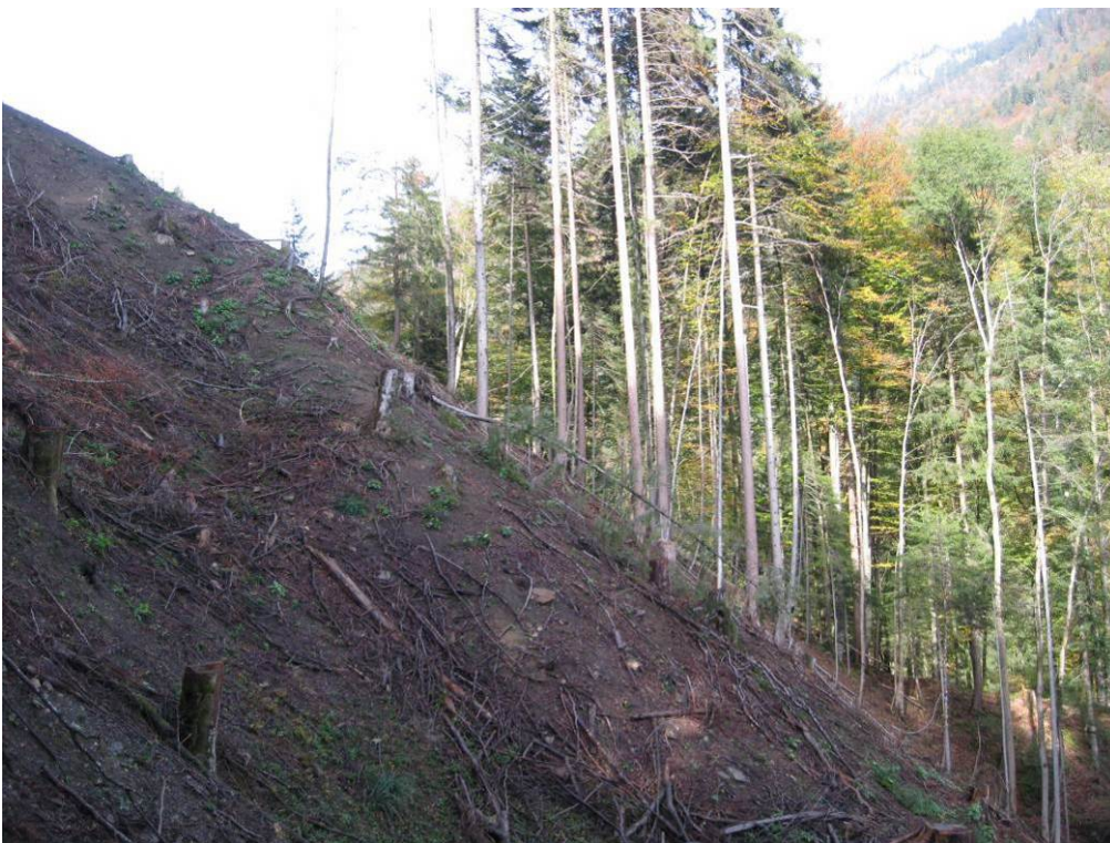
F02 nach Holzschlag 24.10.2009