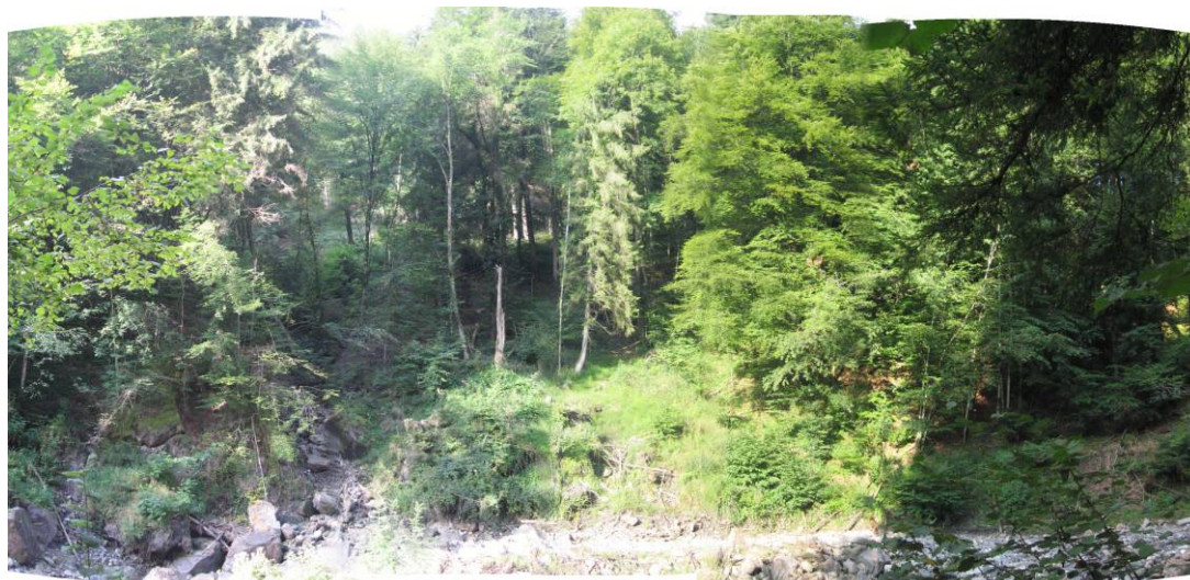
F01 nach der Anzeichnung vom 27.08.2008 - vor Ausführung des Holzschlags