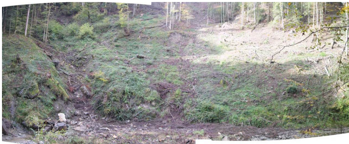
F01 nach Ausführung des Holzschlags 24.10.2009