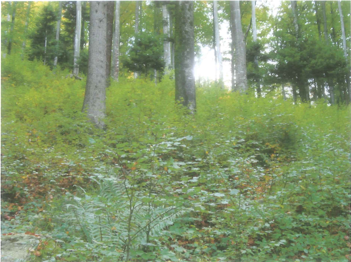
Foto von unten der WF / Buche dominiert