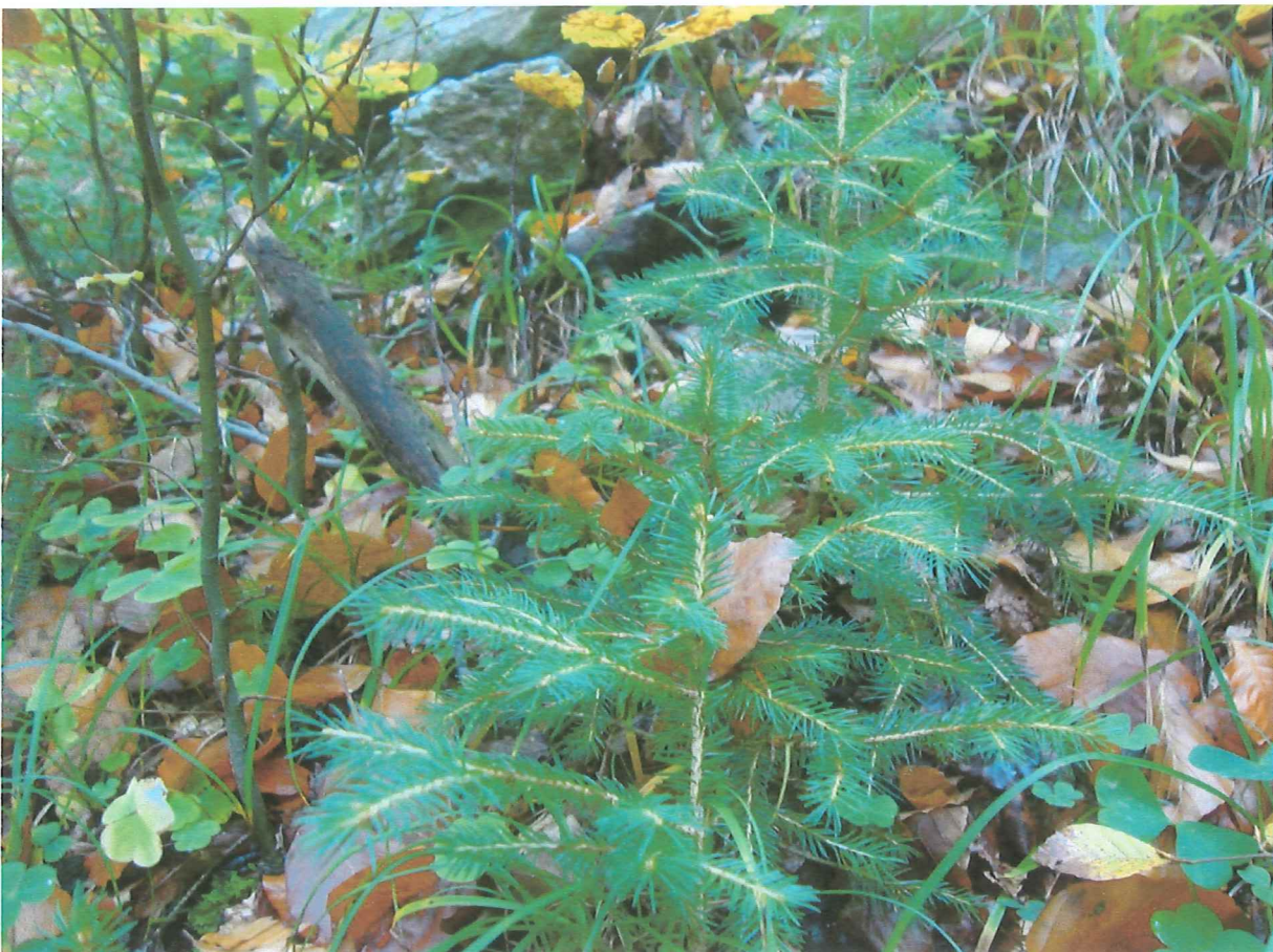
Fichten Anwuchs zwischen den Buchen