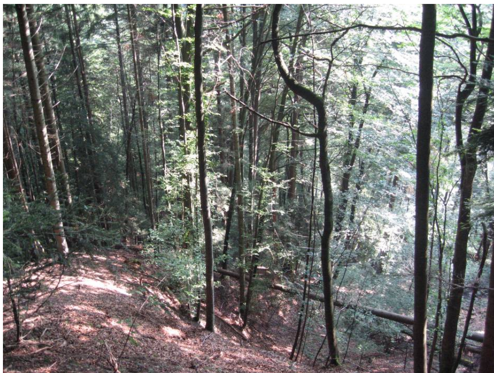
Fotostandort 7 etwas östliche der SW-Ecke; Blick Richtung NNO 27.08.2007