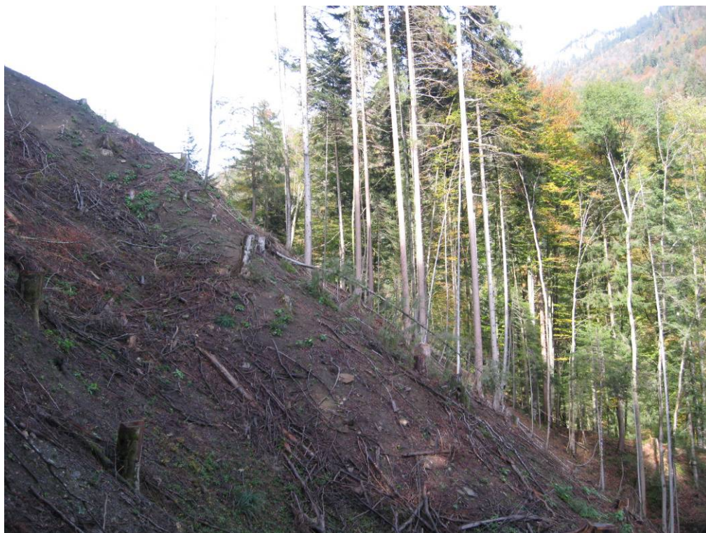
F02 nach Holzschlag 24.10.2009