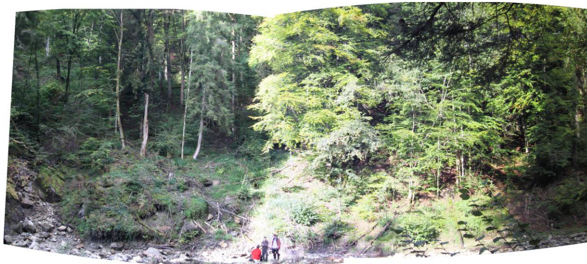
Fotostandort 1 auf der NO-Seite der Kl. Schlieren, neben einem Stock markiert mit roter Farbe; Blick über die NO-Grenze in den unteren Teil der Weiserfläche (direkter Gerinneeinhang)