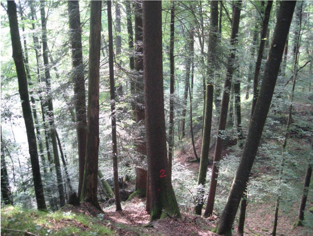
Fotostandort 5 auf der W-Grenze der Weiserfläche (Krete) an einer Birke; Blick Richtung O 27.08.2007