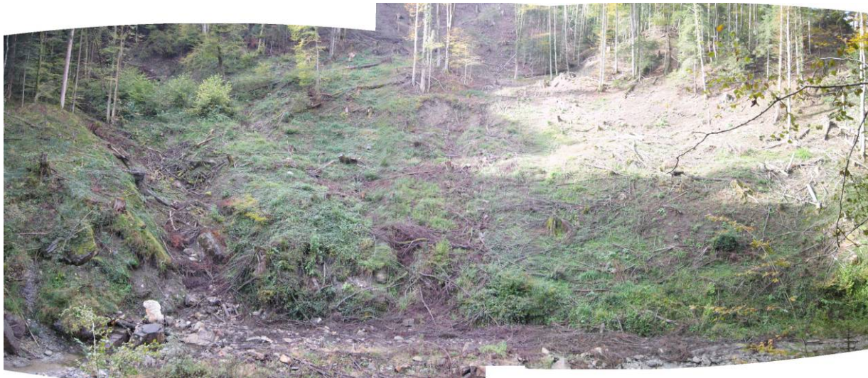
F01 nach Ausführung des Holzschlags 24.10.2009