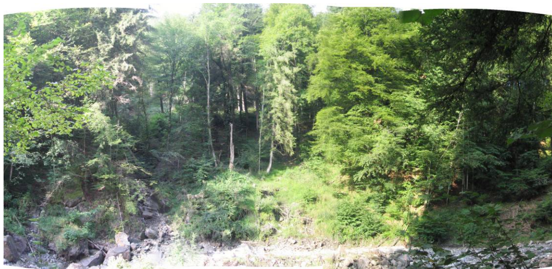
F01 nach der Anzeichnung vom 27.08.2008 - vor Ausführung des Holzschlags 27.08.2008