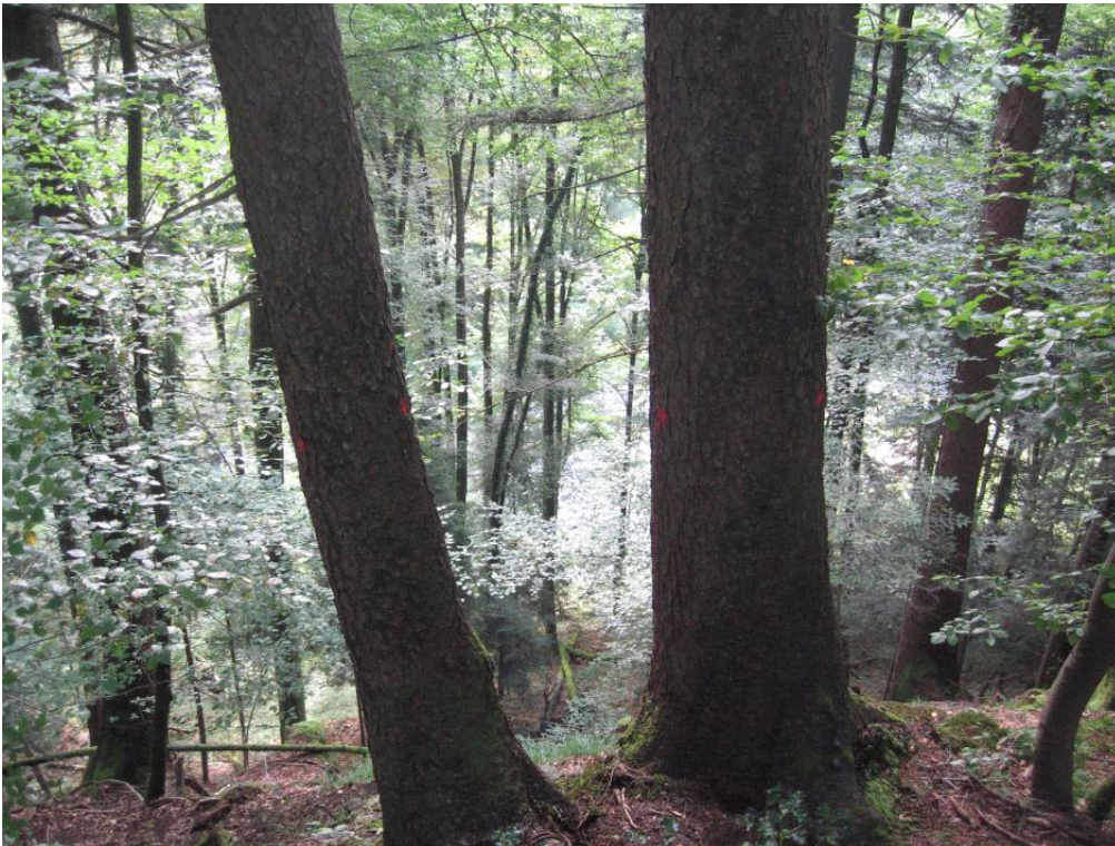
Fotostandort 3 an der NW-Ecke der Weiserfläche; Blick Richtung N-Grenze der Weiserfläche