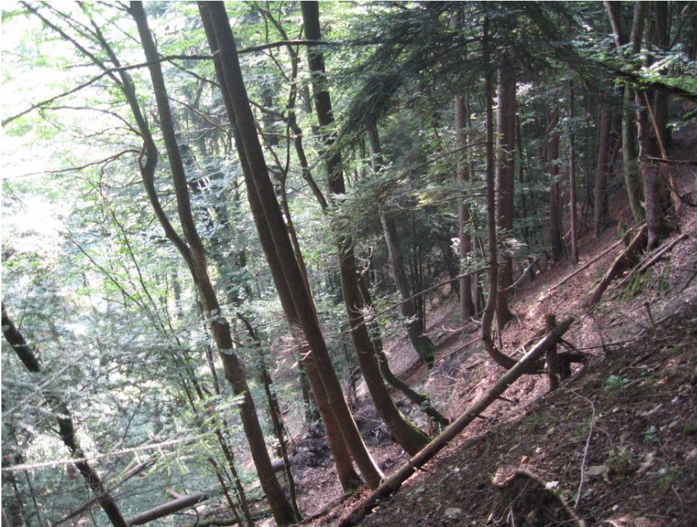
Fotostandort 6 an der SW-Ecke der Weiserfläche; Blick Richtung O 27.08.2007