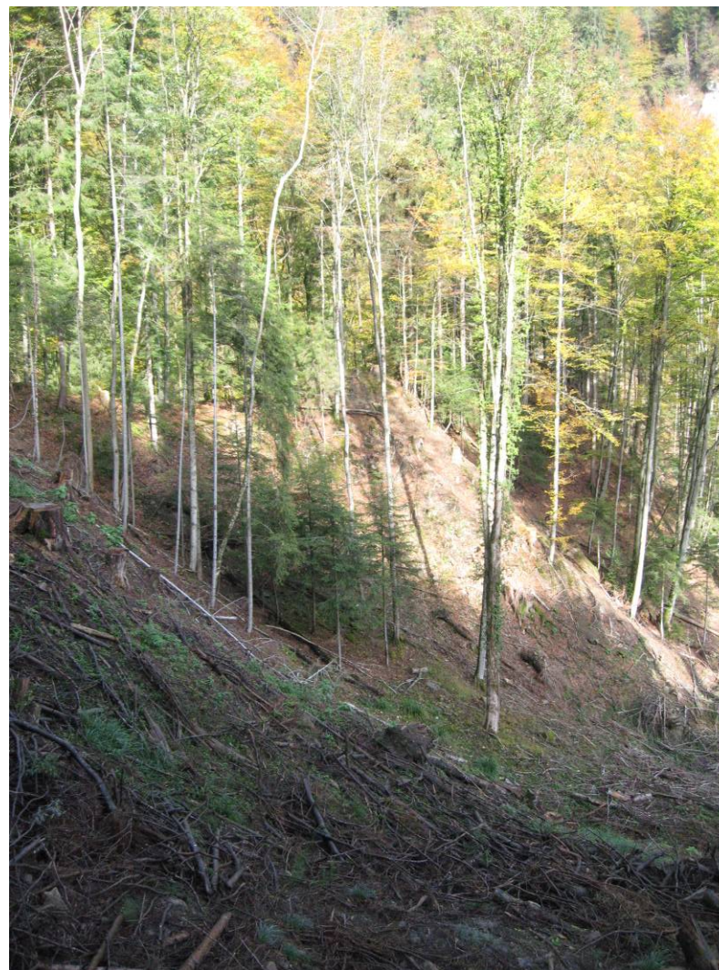
F02 nach Holzschlag 24.10.2009