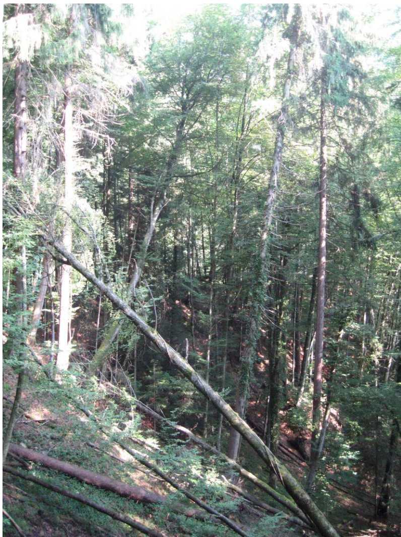
Fotostandort 2 Blick Richtung NNW 19.09.2007