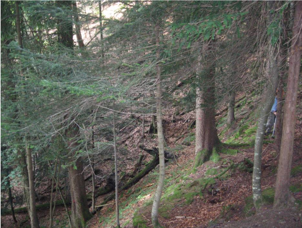
Fotostandort 5 auf der W-Grenze der Weiserfläche (Krete) an einer Birke; Blick Richtung S 27.08.2007