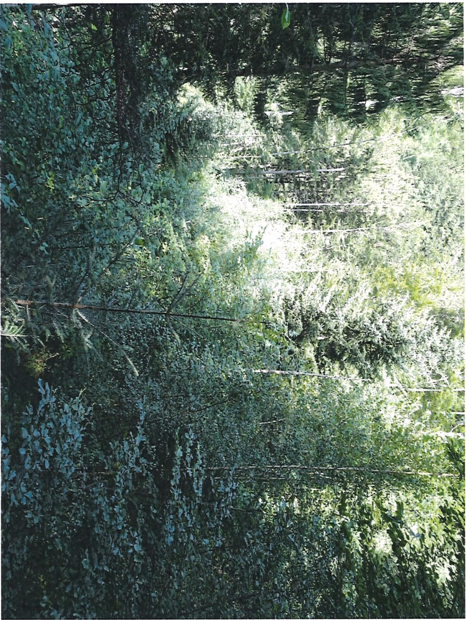
WF 13 / Aufnahme Eckpunkt A Datum: 27.08.2019