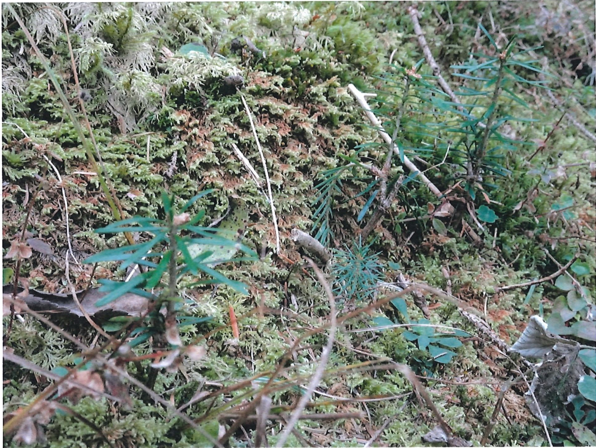
Ansamung Weisstanne und Fichte