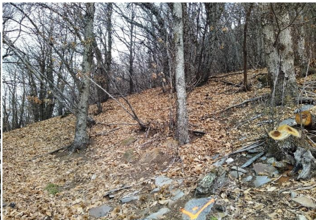
Angolo C, vista verso angolo A