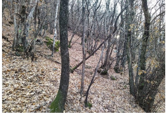
Angolo D, vista in direzione angolo B