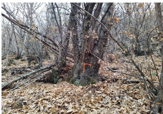
Angolo A: 724'023/121'450