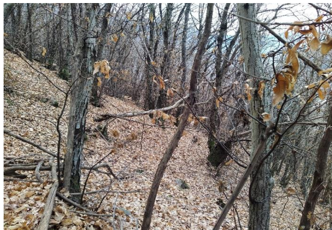
Angolo A, vista in direzione angolo C