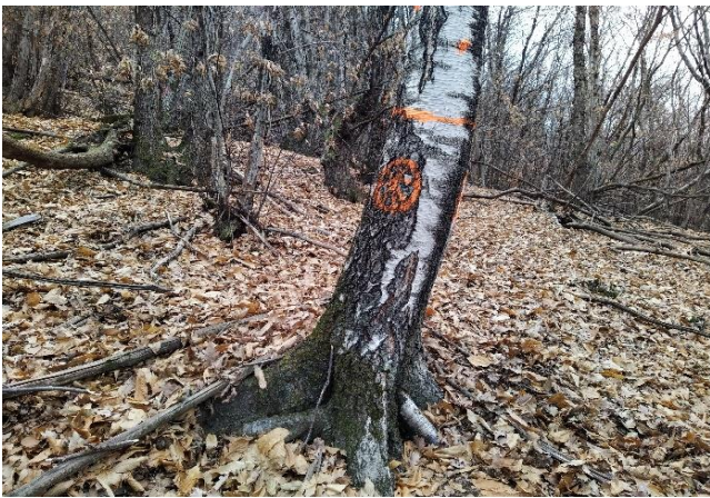
Punto centrale sup. tipo 724'025/121'400