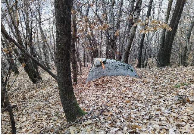
Angolo D: 723'980/121'428