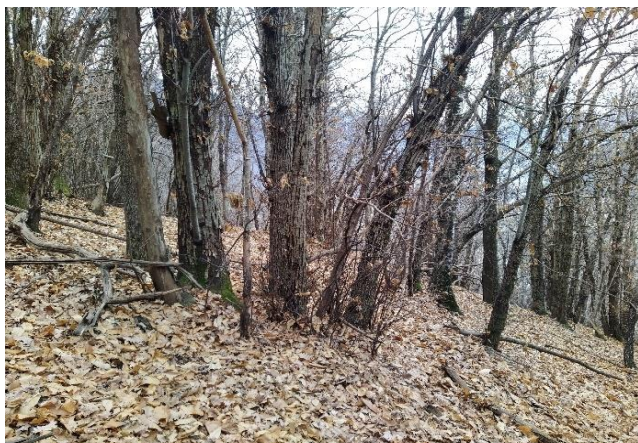
Dal centro direzione angolo C