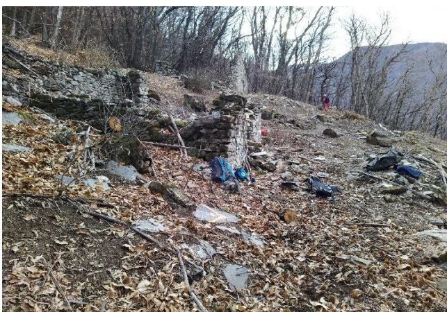
Angolo C: 724'018/121'355