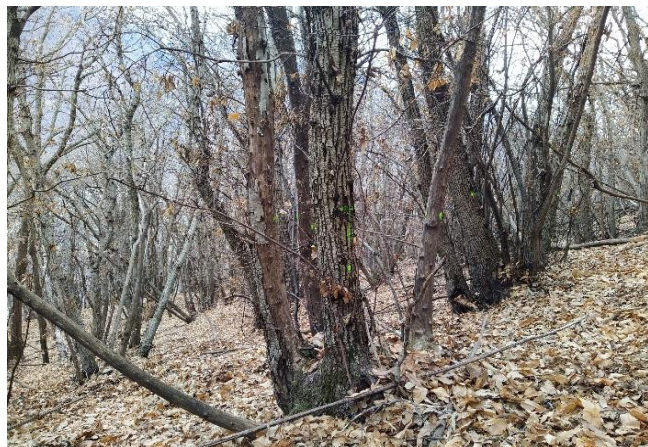
Angolo B, vista in direzione angolo D