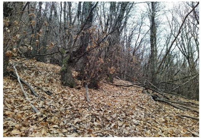
Dal centro direzione angolo B