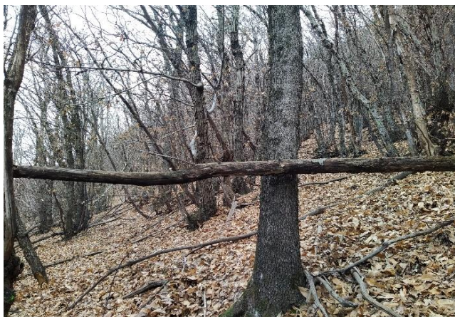
Dal centro direzione angolo A