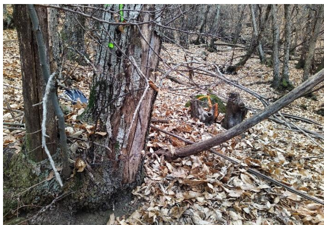
Angolo B: 724'072/121'380