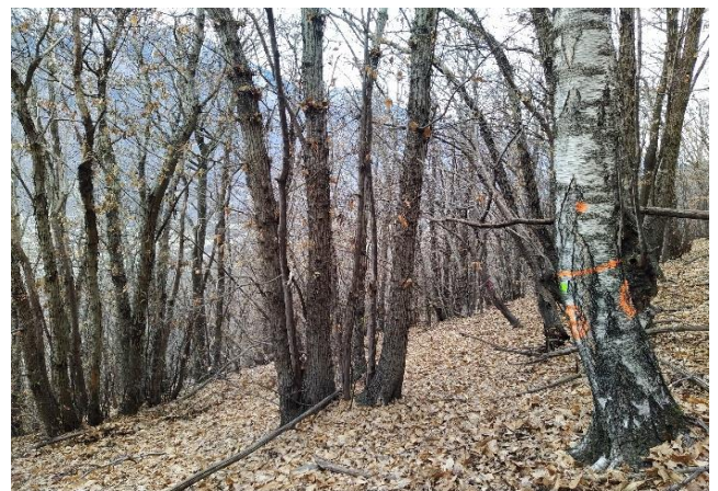
Punto centrale sup. tipo