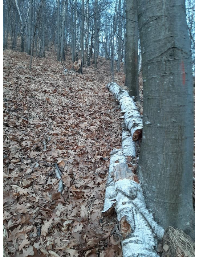
Figura 7: Specie pioniere dominate dalla concorrenza ed inseguito deperite