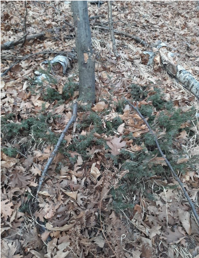
Foto 10: Il ginepro è presente in molte zone nella superficie tipo