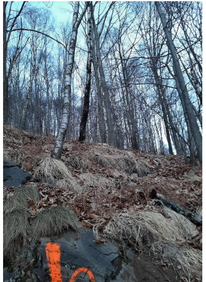
Figura 4: Scatto dal punto 4 (vedi formulario NaiS 1)