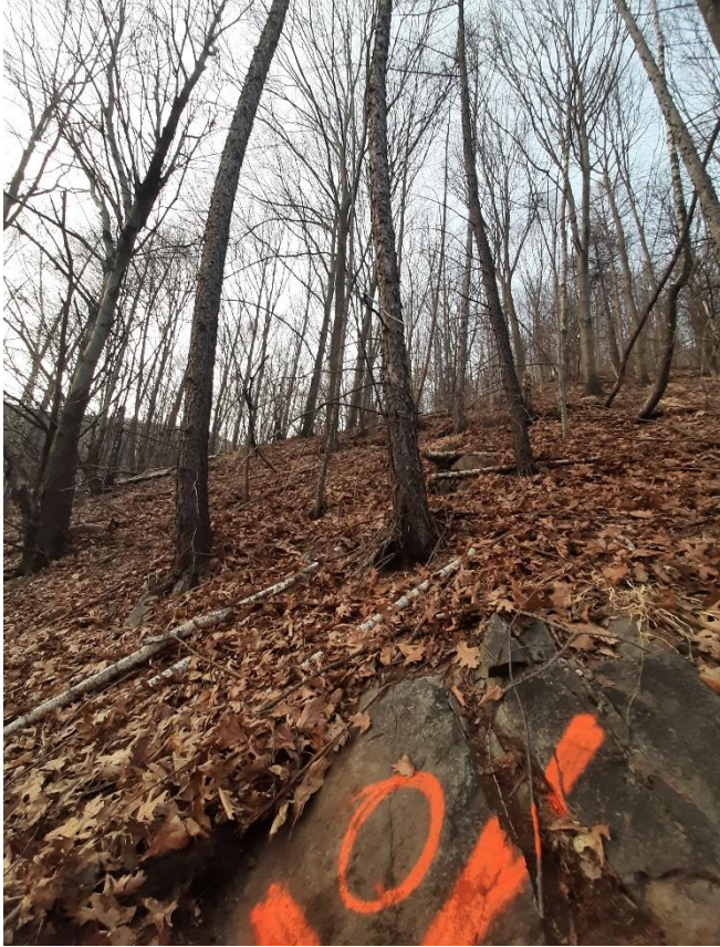
Figura 1: scatto dal punto 1 (vedi formulario NaiS 1)

Foto dagli angoli in direzione diagonale all'altro capo della parcella e centro