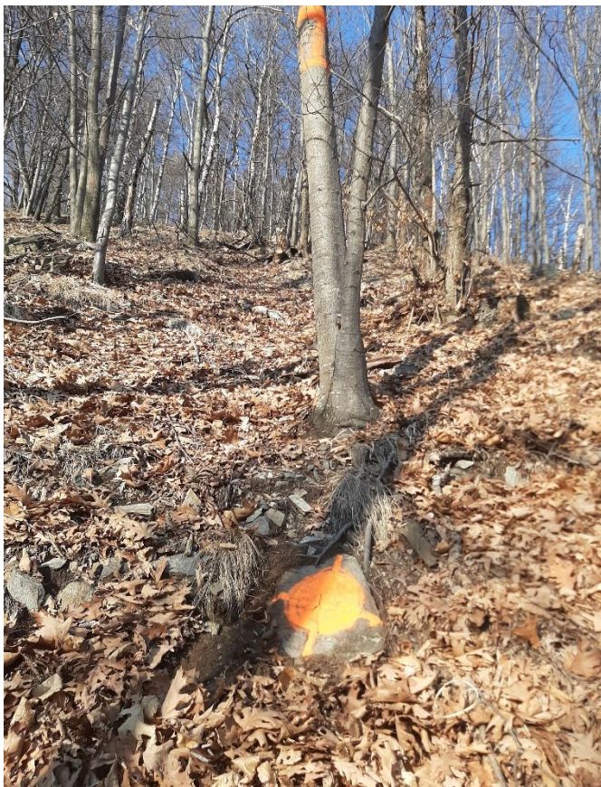
Figura 5: Scatto sul punto 5 centrale (vedi formulario NaiS 1)