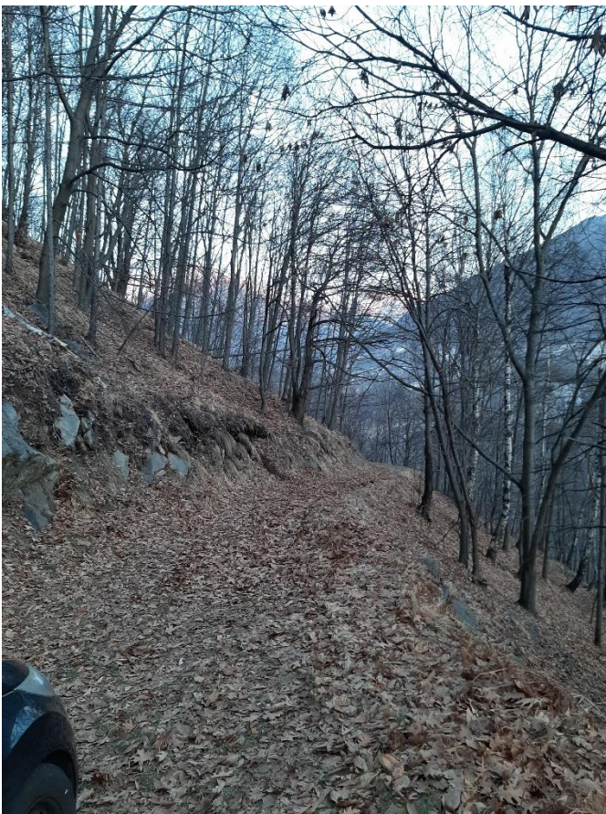
Foto 12: pendio del terreno della piantagione attraversata dalla pista forestale