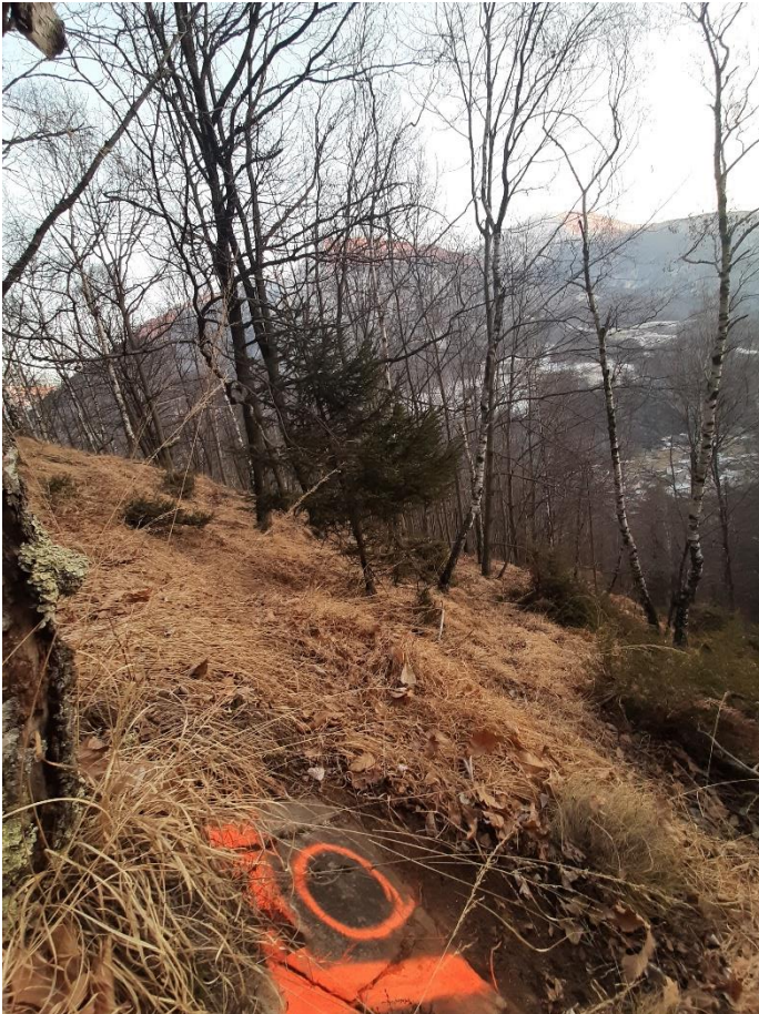
Figura 3: scatto dal punto 3 (vedi formulario NaiS 1)