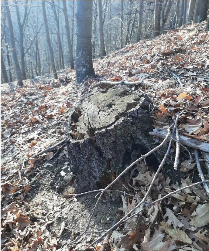
Figura 6: Ceppo di betulla all'interno della superficie tipo (probabilmente risultato di un taglio di sicurezza per la pista forestale)