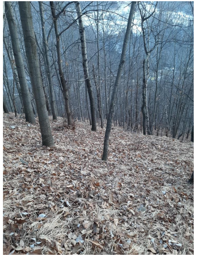
Foto 11: Il sottobosco della superficie tipo è ricoperto da foglie non decomposte e da un folto manto di gramigna