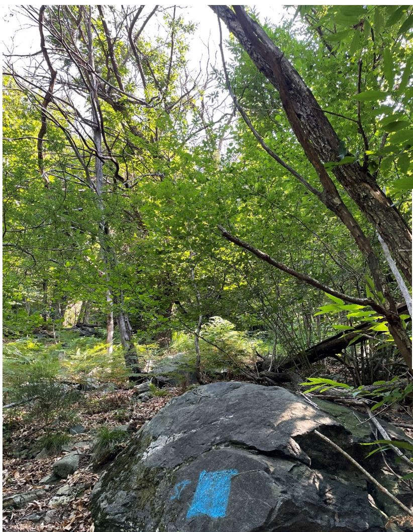
Immagine F1: foto del centro della superficie scattata verso NE. Nella foto si intravedono alcuni dei numerosi castagni con le chiome secche.