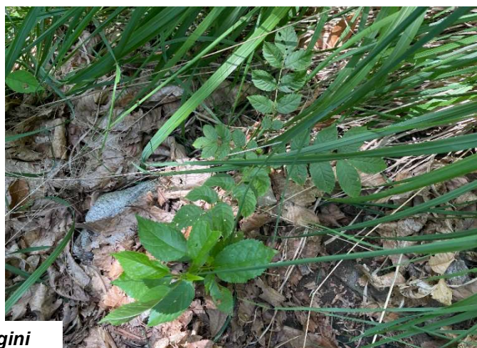
Immagini zona F6

Immagine F5 (sopra): nella foto sono rappresentate le due problematiche principali per il futuro del bosco, il deperimento dello strato principale (chiome secche) e la presenza di una forte concorrenza vegetativa nelle aperture (felci, festuca, rovi). Tuttavia come si può vedere basso a sinistra della foto (novellame castagno) come pure nelle altre 3 foto qui a lato ( "Immagini F6" ) va segnalata la presenza puntuale di semenzali/rinnovazione naturale che andrà però aiutata tramite interventi di cura del bosco giovane per evitare che venga soffocata dalla concorrenza vegetativa.