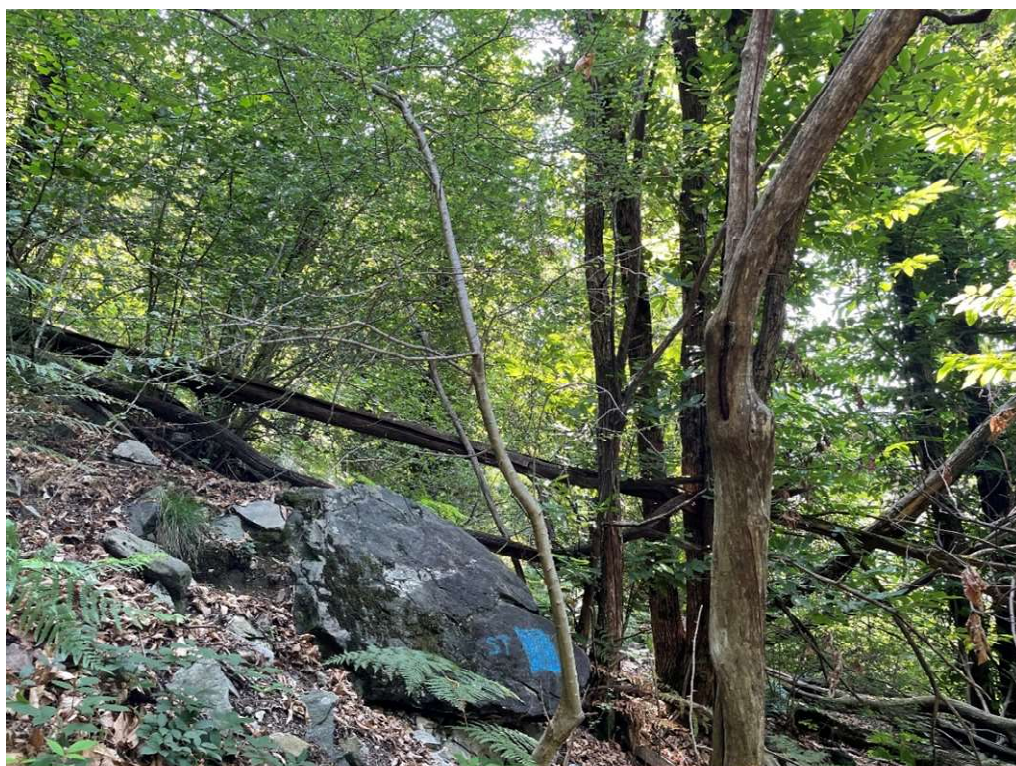
Immagine F2: foto del centro della superficie scattata verso SE. Nella foto si nota la presenza di alberi secchi in piedi e alberi sradicati