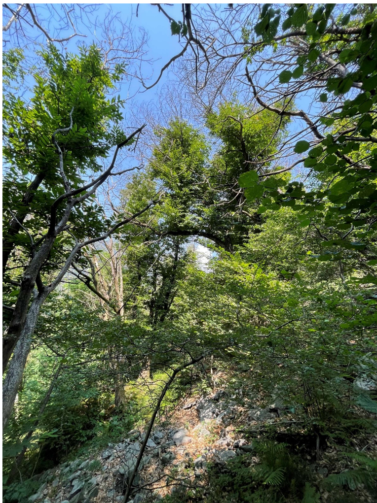
Immagine F4 (a sinistra): foto scattata dal centro della superficie in direzione NO. Nella fotografia si può vedere che quasi la totalità dei castagni presentano chiome secche alle estremità. C'è un forte deperimento dello strato principale.