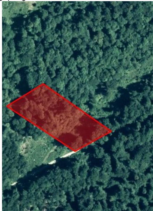
Luftbild 1998