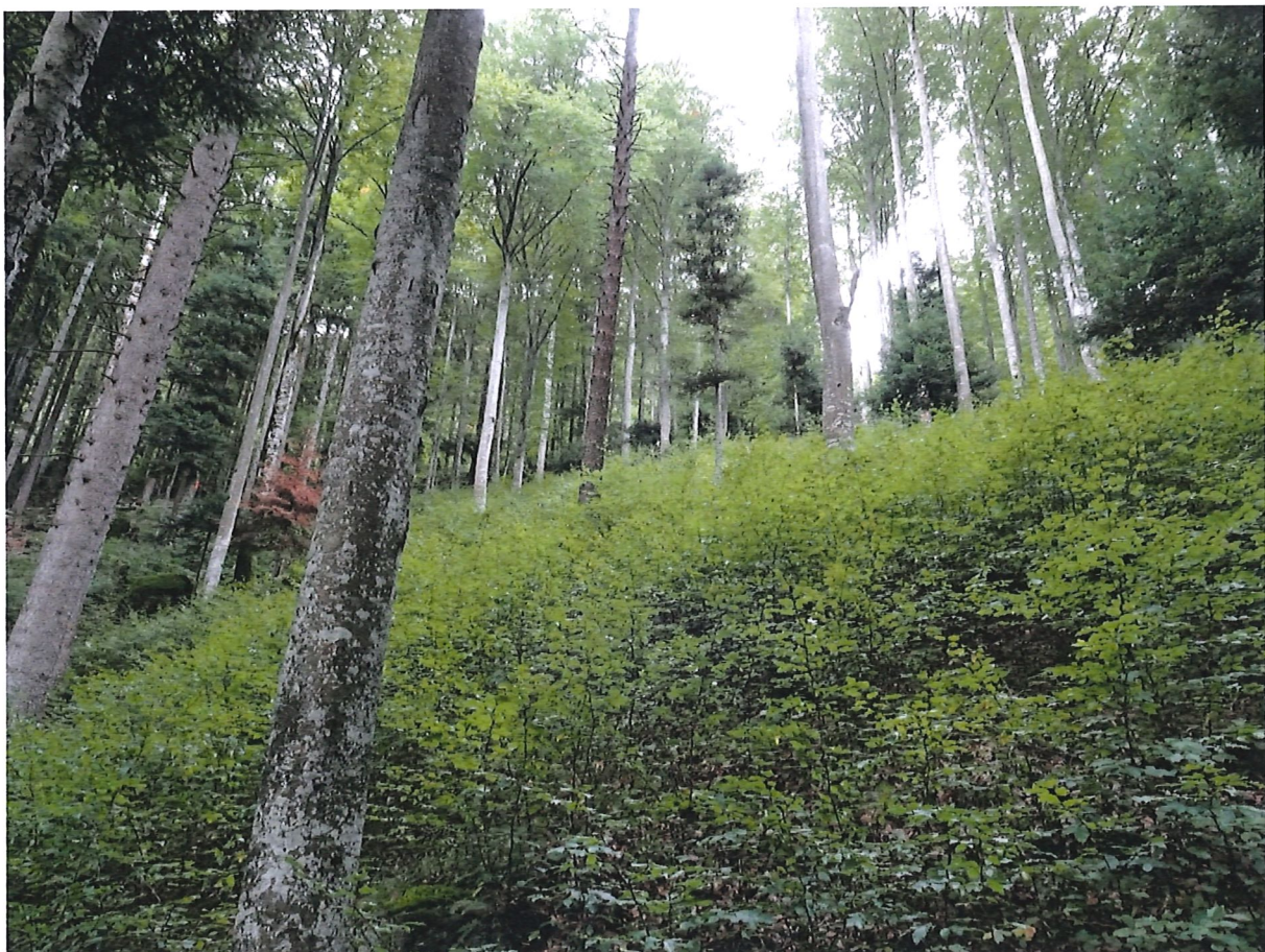
Aufnahme mitte der WF nach oben