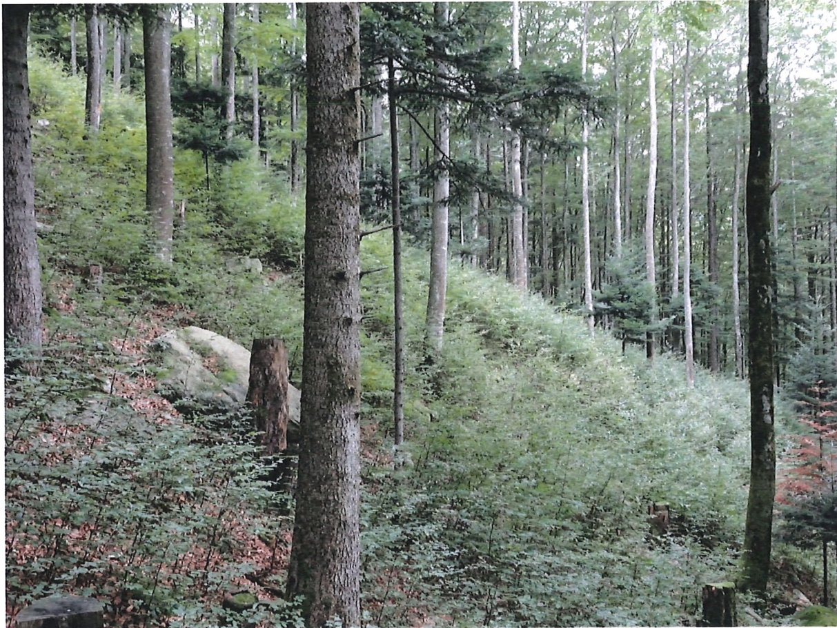
Aufnahme vom rechten Rand der WF